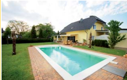
Einfamilienhaus, ca. 179 m 2 459.000 € zzgl. 3,57% Käufercourtage