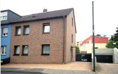
Mehrfamilienhaus, ca. 160 m 2 279.000 € zzgl. 3,57% Käufercourtage