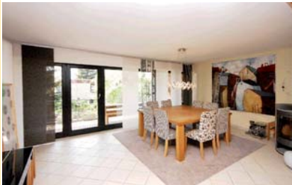
Eigentumswohnung, ca. 255 m 2 319.000 € zzgl. 3,57% Käufercourtage