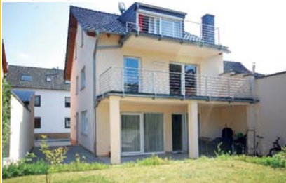
Doppelhaushälfte, ca. 206 m 2 399.000 € zzgl. 3,57% Käufercourtage