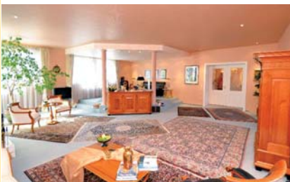
Einfamilienhaus, ca. 380 m 2 985.000 € zzgl. 3,57% Käufercourtage