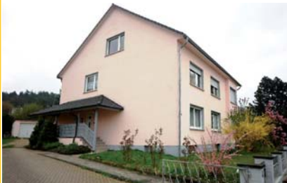
Eigentumswohnung, ca. 88 m 2 89.000 € zzgl. 3,57% Käufercourtage